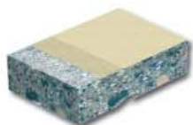
Структурное с Sikadur®-513